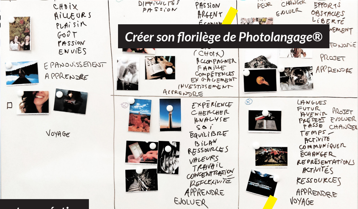
Créer son florilège de Photolangage®