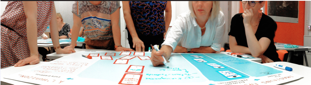
Objectiver les situations problématiques par le jeu

Concevoir un dispositif de formation avec le jeu de cartes Learning Battle Cards®