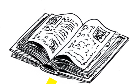
Le Dessin pour gagner en attention

> TEACH / LABS / U 2 NI . V L * OR - << } RAINE