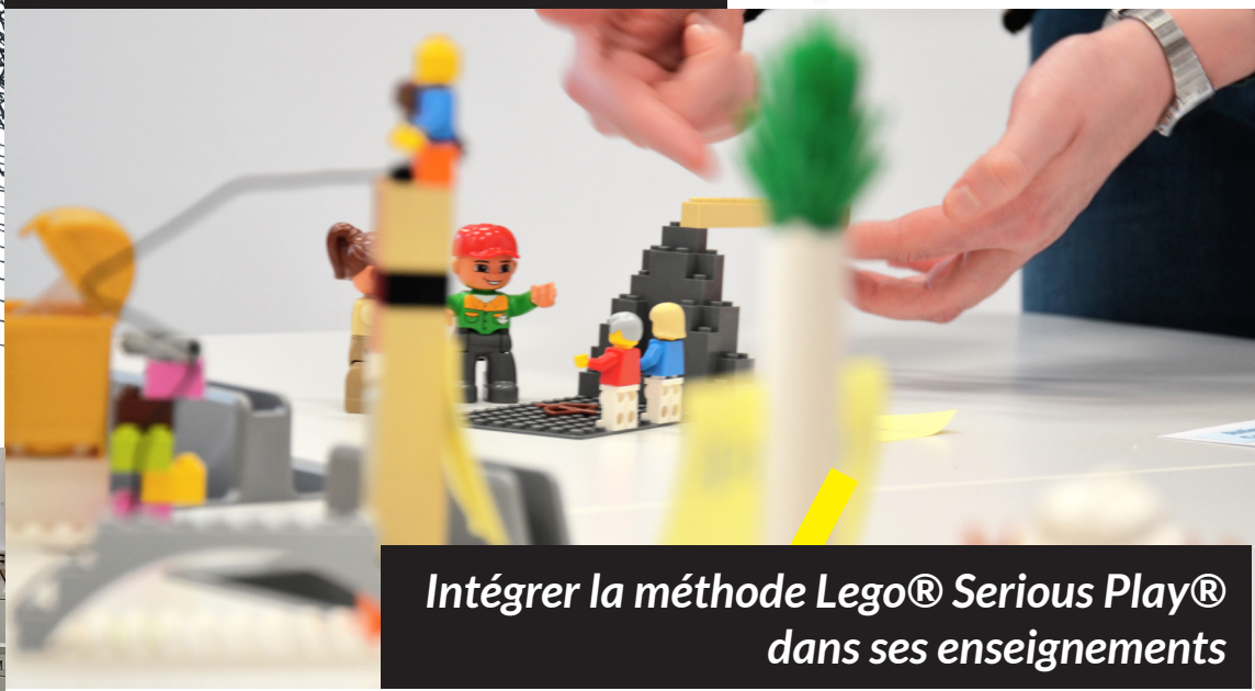
Intégrer la méthode Lego® Serious Play® dans ses enseignements

> TEACH / LABS / U 2 NI . V L * OR - << } RAINE