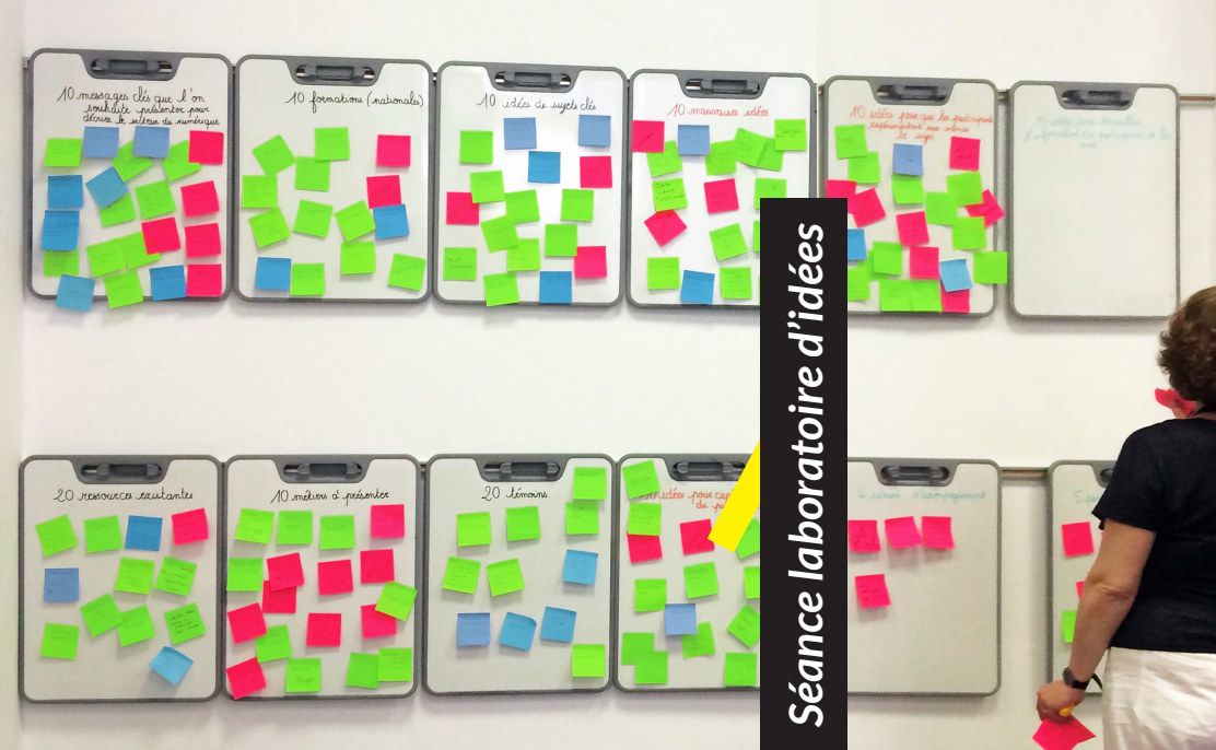
Séance laboratoire d'idées