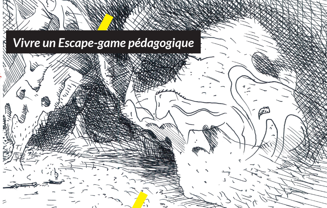
Vivre un Escape-game pédagogique

Le TeachLab Saint-Gobain est un espace dédié à l'émergence d'expériences nouvelles, de formations, d'ateliers et d'accompagnements à la mutation pédagogique au sein de l'Université de Lorraine.