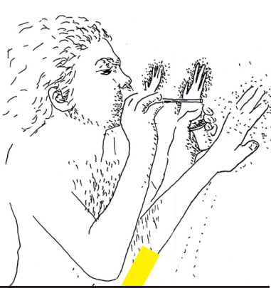
Dessiner son cours...